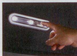
Autostan má i zabudovanou lampičku