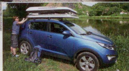
Než postavíte autostan, musíte odjistit pojistky a klikou střechu vytočit

Potom zbývá rozložit žebřík – a můžete se jít natáhnout