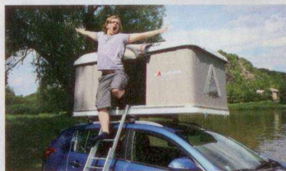
Autostan má výhodu v kvalitní matraci. Vyspíte se perfektně.